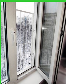
Фиксаторы, ограничители поворота